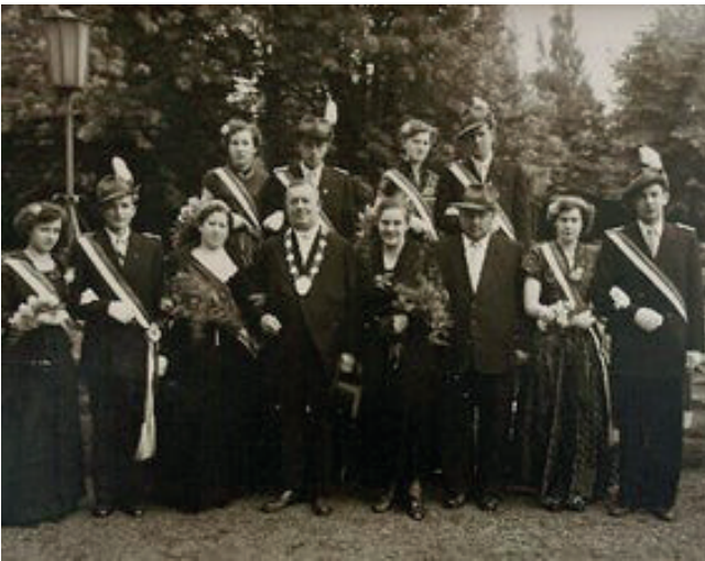
Präsidentenpaar (vorne Mitte)